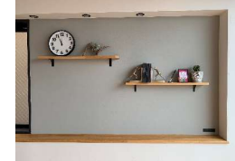
三角ラケット+棚板 付けちゃいました

「ここに棚が欲しいな〜」ということで、後から付けちゃいました。壁に棚を付けるには、ビスが効くかどうかを確かめる必要があります。住宅の壁は石膏ボードなので、ビスは効きません。石膏ボードの下に下地があるか、もしくは石膏ボード用のビスを使うかで取付が可能になります。「何か難しい〜」と思った方、ネクストがサポートいたします。お気軽にお電話ください。取付に行きますよ〜♪