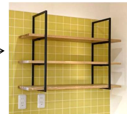
壁付けラダー+棚板 付けちゃいました