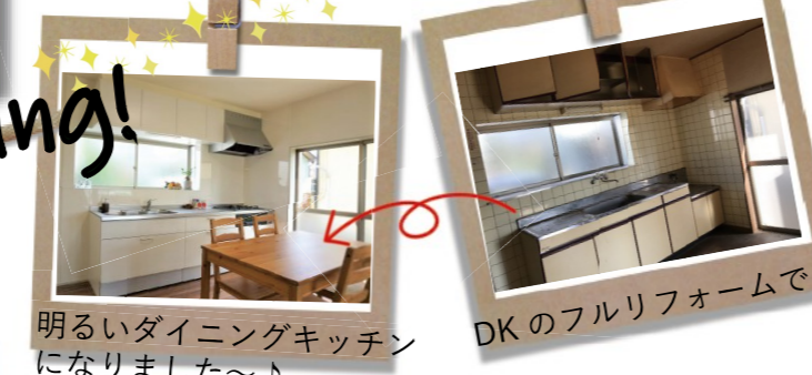
明るいダイニングキッチンになりました〜♪