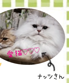
まめ太さん 愛猫♡♡♡ ナッツさん