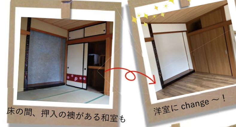
床の間、押入の襖がある和室も