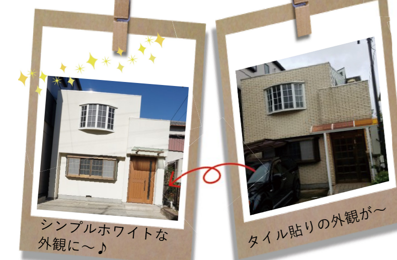
シンプルホワイトな外観に〜♪