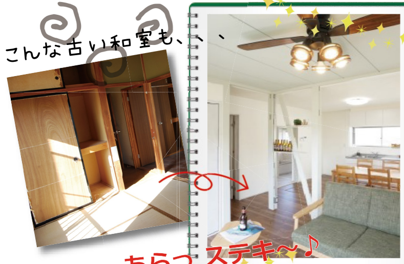
こんな古い和室も、

ネクストでは、住み慣れたおうちをより快適にするための大規模な増改築から、数時間で完了するちょっとしたリフォームまで、ご希望に合わせて幅広くご提案させていただきます。まずはお気軽にお問い合わせください。