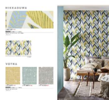
サンダツ壁紙 壁紙選びは家づくりの中でも重要な工程。サンダツの5000(ワイルド)は個性的なデザインが魅力！