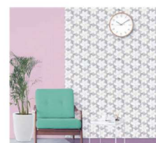
名古屋ゼイタイ キッチンが映えるアクセントに、高級感が増える。色味も個性溢れる。お洒落な空間にしたい！やっぱり美しい空間にしたい！