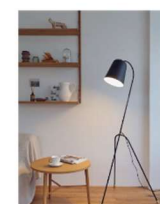
オルネド フォイユ 東京不動産のインテリアショップ「フラッシュ・ヨーロッパ」などからの輸入品を取り扱っている。即座に商品などもっと変わったデザインがあって、お洒落。