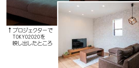
↑プロジェクターでTOKYO2020を映し出したところ