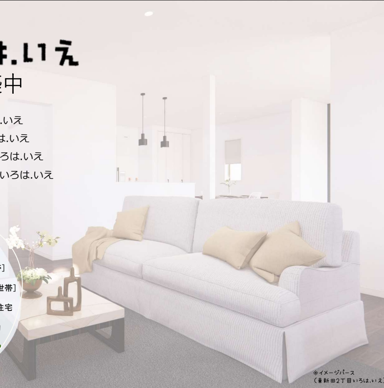
※イメージパース (東新田2丁目いろはいえ)